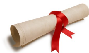
Zertifikat TÜV SÜD

Die fortschreitende Digitalisierung durchdringt alle Bereiche unserer Berufs- und Arbeitswelt. Auch im Prüfungsumfeld wird es für die Teilnehmer maßgeblich, Prüfungen schneller abzulegen und Ergebnisse direkt im Anschluss zu erhalten. Um diesen Anforderungen gerecht zu werden, wird die HERMES Advanced Prüfung zu Beginn 2020 auf ein neues Prüfungsformat mit